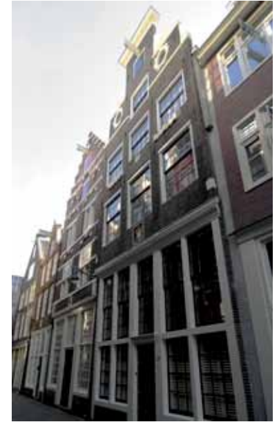
Dirk van Hasseltssteeg 51-53