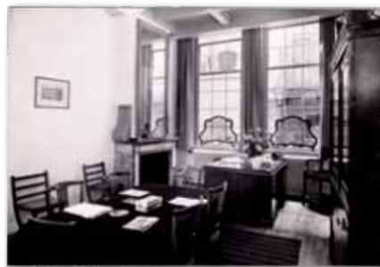
Kamer van het hoofd van Bureau Monumentenzorg in Dirk van Hasseltssteeg 51-53. Ongedateerde foto.